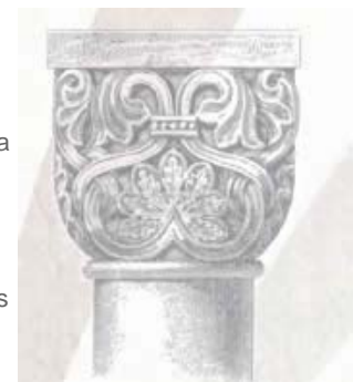
Quatro faces da Cabala. A tradição cabalista pode ser dividida em quatro aspectos: teórico, meditativo, prático e cotidiano. O teórico é a base dos conhecimentos e está nos livros: o Sefer Ietzirá , o Bahir e o Zohar . O meditativo reúne palavras,

Apesar de não dispormos de notícias seguras do caminho de transmissão das obras de Filon aos judeus da Idade Média, sabemos que alguns pensadores orientais conheciam as suas idéias 5 . Além disso, os estudos sobre a diáspora dos judeus de Alexandria que, durante muito tempo foi um centro cultural muito mais importante e produtivo do que a própria Jerusalém, são muito escassos. Pelo fato de Filon ter escrito suas obras em grego - e não em hebraico - muitos suspeitam que a comunidade judaica de Alexandria poderia ter produzido mais do que hoje identificamos como obra sua. Por outro lado, nada impediria que, se houvesse realmente uma escola de orientação platônica no judaísmo, estas idéias tivessem sido mais disseminadas do