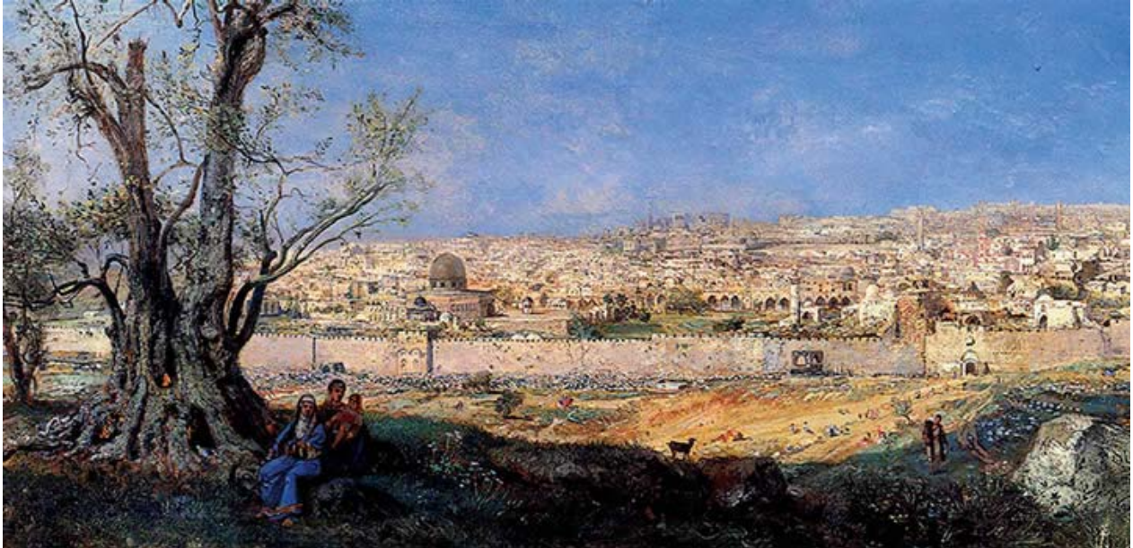
Visão de Jerusalém, por Pierre Tetar Van Elven Os pensamentos hebraico e grego estão unidos, em especial, pelo que houve de comum intelectualmente entre Jerusalém e a Alexandria

A influência filosófica grega é mais forte e visível nas correntes mais especulativas e menos mágicas, encontradas no primeiro período da Kabbalah , na Península Ibérica, na linha apresentada por Moshe Cordovero (RamaAMaK) e em variantes posteriores geograficamente localizadas, especialmente o pensamento yemenita. Concorrente do modelo de Isaac Luria, que é o mais popular até nossos dias, a produção mística de Moshe Cordovero aproveita essas contribuições, utilizando o esquema de harmonização entre o pensamento neoplatônico e aristotélico, "aplicando uma variante da literatura que apareceu primeiro no sistema de Ibn Gabirol". Cordovero utiliza o conceito grego das esferas, da alma tripartida e da mediação entre Deus e a Criação.