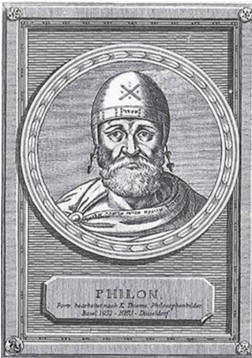
Filon de Alexandria é considerado o primeiro filósofo a tentar compatibilizar o pensamento platônico e as escrituras sagradas do judaísmo

e fêmea; e estes, por sua vez, Ele os fez dependentes de alguma outra forma que é ao mesmo tempo macho e fêmea". Mais adiante naquele texto é reafirmada a semelhança entre os mundos superior e inferior, apresentando a relação de Imagem que o mundo Inferior mantém para com seu arquétipo: "mas, sabeis que isso é a súpula do tema inteiro: tudo no mundo Inferior foi feito à imagem do mundo Superior. Tudo que existe no Mundo Superior se manifesta aqui em baixo como num retrato". Segundo o Zohar , "tudo é uma única e mesma coisa".