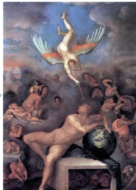
Alegoria da Vida Humana, de Alessandro Allori. Um dos paralelos entre a Filosofia platônica e os ensinamentos contidos no Zohar é a idéia da existência de dois mundos: um superior, perfeito, e outro inferior, cópia imperfeita

Ainda podem ser observados os ecos da proposta platônica do andrógino perfeito: "quando Deus quis criar todas as coisas ele começou criando algo que era ao mesmo tempo macho