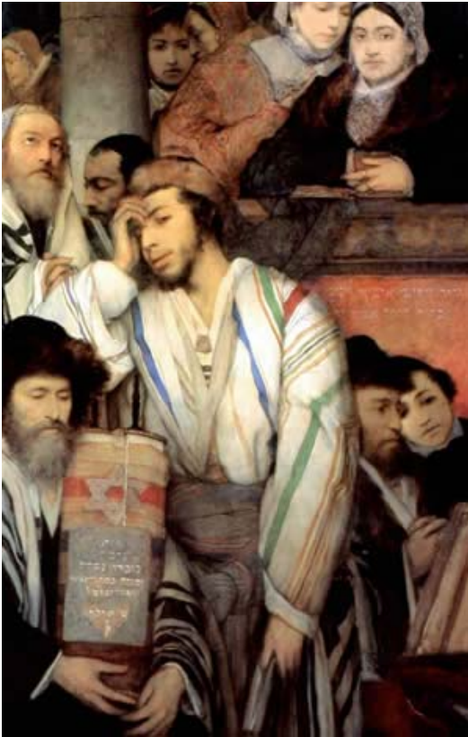
Judeus rezando na sinagoga. O período inicial de contato entre judaísmo e Filosofia grega é incerto. Alguns estudiosos acreditam que ele se deu ainda na época da redação dos livros sapienciais

Associando-se a interpretação mística do Bereshit estruturada no modelo sefirótico, à alusão da criação por fases em Isaías 43:7, surge um modelo de geração por emanções sucessivas, no qual a Luz desempenha um papel fundamental.